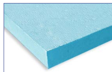
Schiuma di polistirene